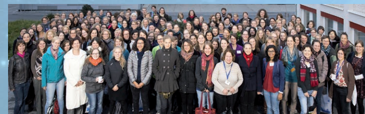
Deutsche Physikerinnentagung 2016

Die wissenschaftliche Diskussion, aber auch der Erfahrungsaustausch und die Vorstellung beruflicher Perspektiven von Physikerinnen stehen dabei im Mittelpunkt. Eingeladen sind alle, die sich der Physik und der Gleichstellung in der Physik verbunden fühlen.