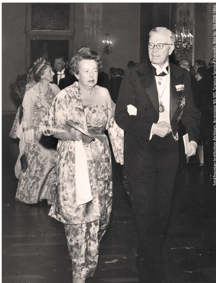
Abb. 1 Maria Goeppert Mayer wird von König Gustav VI. Adolf von Schweden zum Gala-Bankett nach der Nobelpreisverleihung begleitet.

In der Veröffentlichung der Dissertation in den Annalen der Physik hebt Goeppert in den Danksagungen zwei Personen hervor: ihren Doktorvater und Mentor Max Born, zu dessen Familie sie eine enge Beziehung pflegte, sowie ihren Studienkollegen und Freund Victor Weisskopf, der ebenfalls bei Born promovierte [4]. In Göttingen hatte Goeppert einen engen akademischen Freundeskreis, zu dem unter anderem Hertha Sponer und James Franck gehörten. 1929 kam der amerikanische Physiko-Chemiker Joe Edward Mayer als Postdoc nach Göttingen, um mit Franck und Born zu arbeiten. Da Mayer sein erstes Zimmer in Göttingen in der Wohnung der Familie Goeppert zur Untermiete bezog, lernte er dort Borns Doktorandin Maria Goeppert kennen, die er 1930 heiratete.