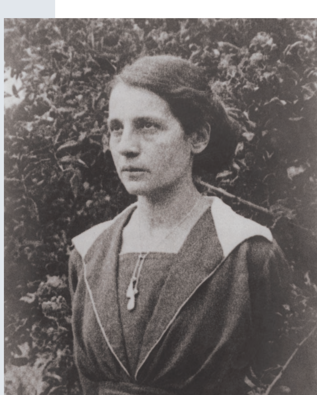
Bild oben Lise Meitner Archiv zur Geschichte der Max-Planck-Gesellschaft

„Haben Sie verbindlichsten Dank für die gütige Zusendung eines Sonderdruckes Ihrer schönen Arbeit der die Wirkung von Neutronen auf die Seltenen Erden zeigt. Sie haben die Probleme mit Meisterhand gelöst und niemand wird Ihre Arbeit mit mehr Interesse lesen als diejenigen, die versucht haben, dem Problem etwas näher zu kommen.“